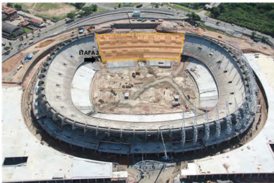
Edifício Central (Ago/2012)