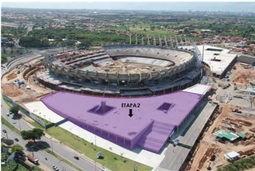
Estacionamento Coberto 2 (Dez/2011)