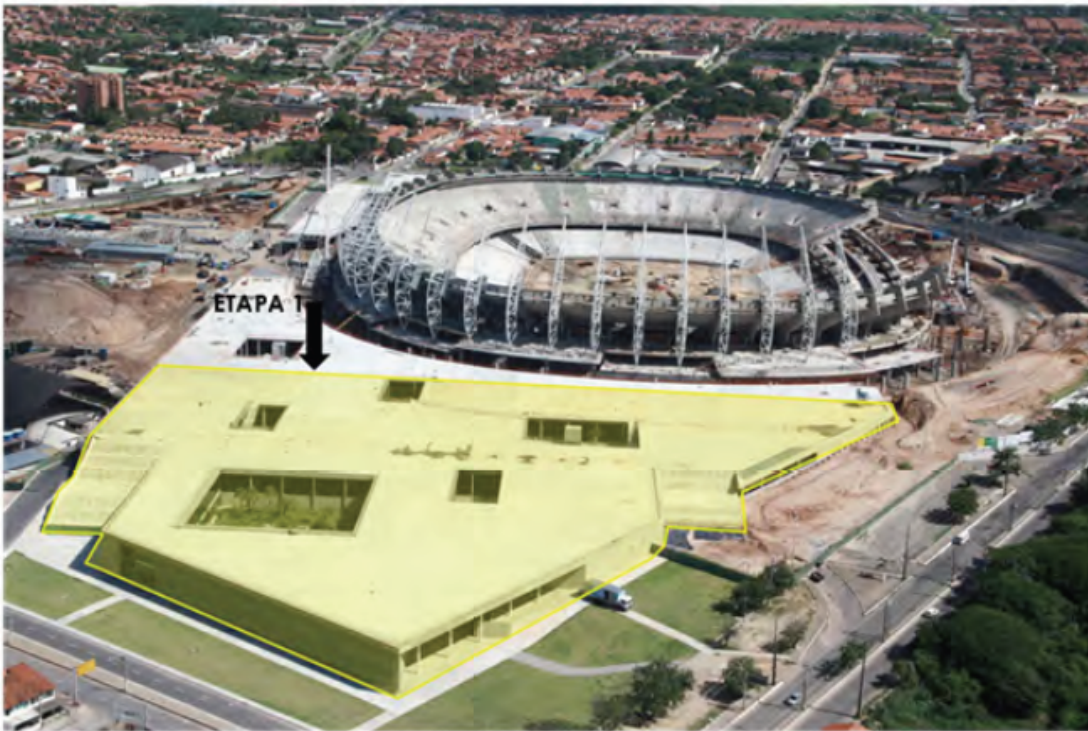
Edifício Sede SESPORTE e Estacionamento Coberto 1 (Ago/2011)