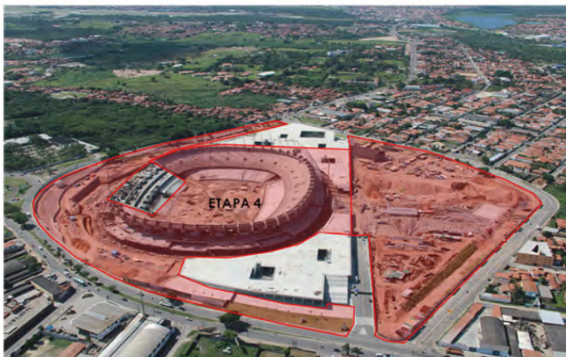
Disponibilização da totalidade do Estádio (Dez/2012)