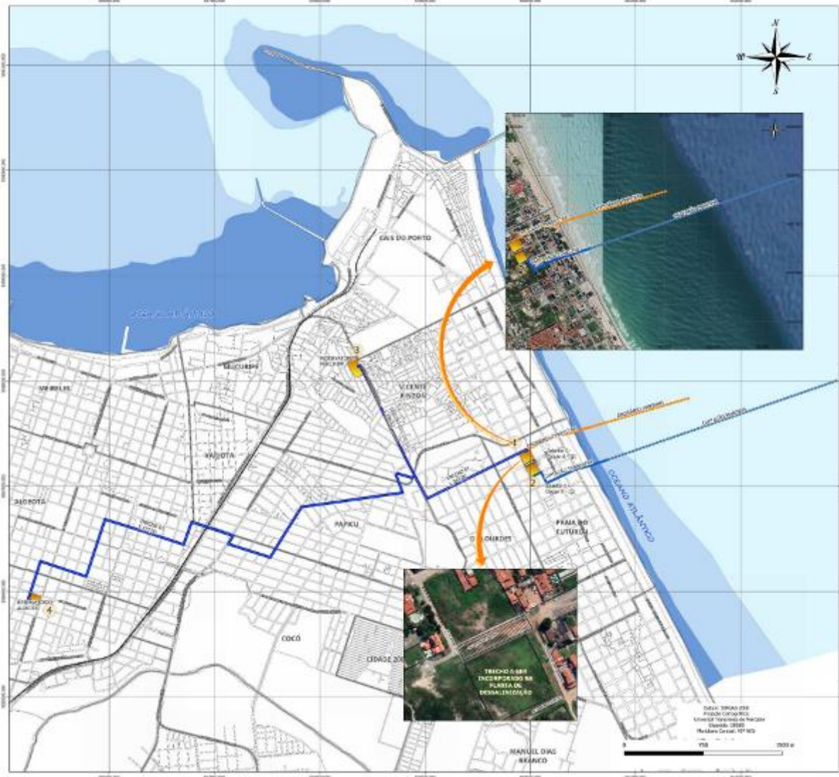
Figura 1. Localização da área da planta de dessalinização e das linhas de captação, emissário e de água tratada.

Documento assinado eletronicamente por: NEURISANGELO CAVALCANTE DE FREITAS em 10/04/2023, às 15:49 JOSE CARLOS LIMA ASFOR em 04/04/2023, às 18:19 e outros; (horário local do Estado do Ceará), conforme disposto no Decreto Estadual nº 34.097, de 8 de junho de 2021. Para conferir, acesse o site https://suite.ce.gov.br/validar-documento e informe o código 41DC-3734-0A5A-1B94.